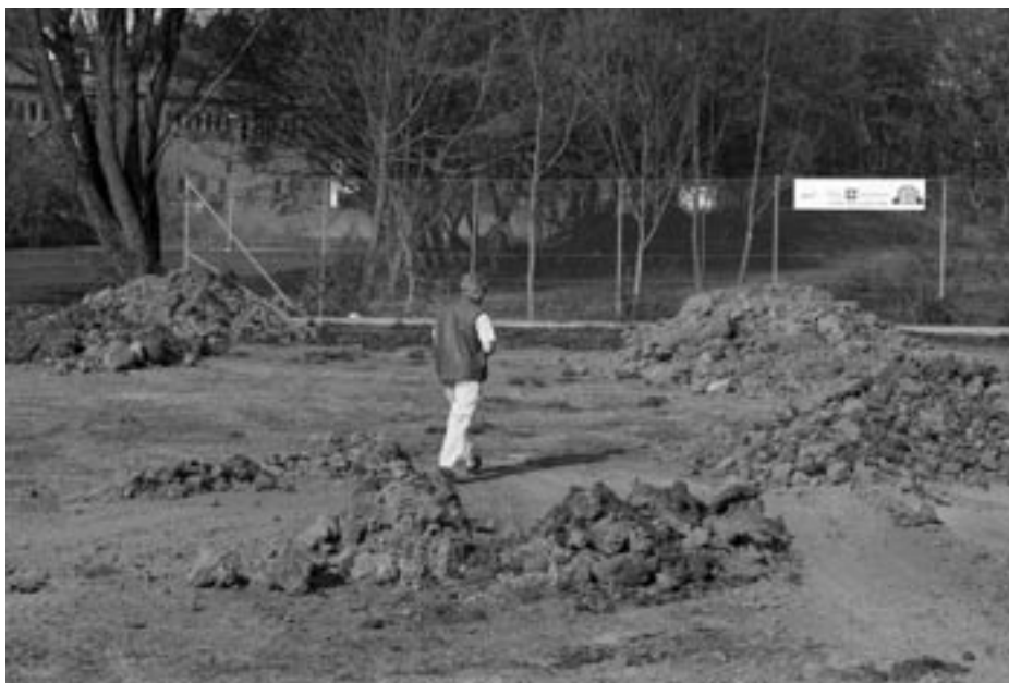
Grusplanen i Enhagsparken ersätts med gräsmatta och här blir också plats för planteringar och sittplatser.