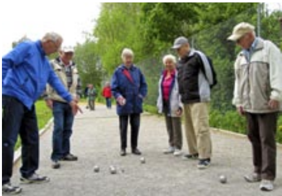
Täby Centrums PRO-förening trivs på Ellagårds boulebana.