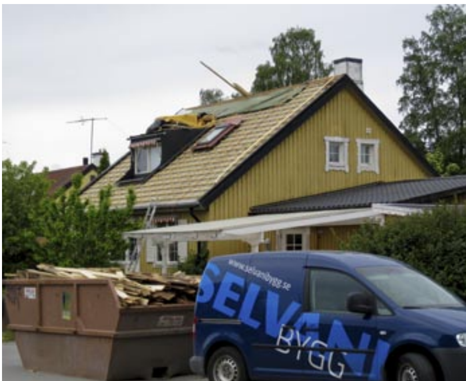
Det renoveras överallt i Ellagårdskvarteren. Framför allt läggs nya tak som här på bilden, men även ommålning och fönsterbyten är aktuella. Från 1 juli gäller nya regler för Rotavdragen, se www.regeringen.se/sb/d/11257 .

Och det renoveras och byggs som aldrig förr (?) i Ellagård. Bara på Skiftesvägen står det hantverksbilar utanför ett tiotal hus och tre lägger också om sina tak.